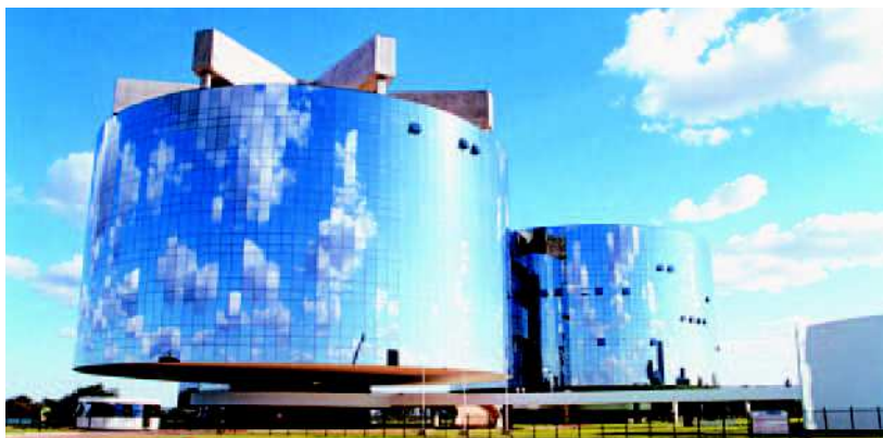
Procuradoria Geral da República LOCAL Brasília – DF ENTREGA DA OBRA 2002 CONSTRUTORA Serveng Civilsan S.A. LINHA BELMETAL Atlanta SERRALHERIA Master Esquadrias Indústria e Comércio de Artefatos de Alumínio