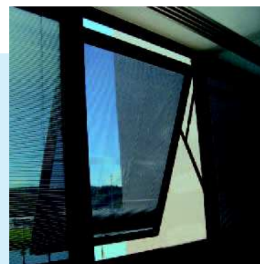
Centro Administrativo de Minas Gerais LOCAL Belo Horizonte – MG ENTREGA DA OBRA 2010 CONSTRUTORA Camargo Corrêa | Mendes Jr. | Santa Bárbara LINHA BELMETAL Offset Wall SERRALHERIA Engevidros Engenharia e Comércio de Vidros Ltda