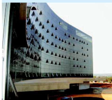
TST – Tribunal Superior do Trabalho LOCAL Brasília – DF ENTREGA DA OBRA 2005 CONSTRUTORA Construtora OAS LINHA BELMETAL Offset Wall SERRALHERIA Pró Alumínio